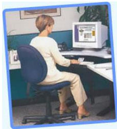
Se recomienda mantener una postura recta y relajada

A continuación se presentan los efectos sobre el cuerpo (si no se tienen las condiciones adecuadas) de permanecer frente a la computadora por más de seis horas diarias, bien sea en actividades laborales, disfrutando del video juego favorito, navegando en Internet, chateando con los amigos o escribiendo la tesis de grado. Entre las zonas más susceptibles destacan la columna vertebral, espalda, ojos y manos.