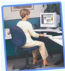
Se recomienda mantener una postura recta y relajada

A continuación se presentan los efectos sobre el cuerpo (si no se tienen las condiciones adecuadas) de permanecer frente a la computadora por más de seis horas diarias, bien sea en actividades laborales, disfrutando del video juego favorito, navegando en Internet, chateando con los amigos o escribiendo la tesis de grado. Entre las zonas más susceptibles destacan la columna vertebral, espalda, ojos y manos.